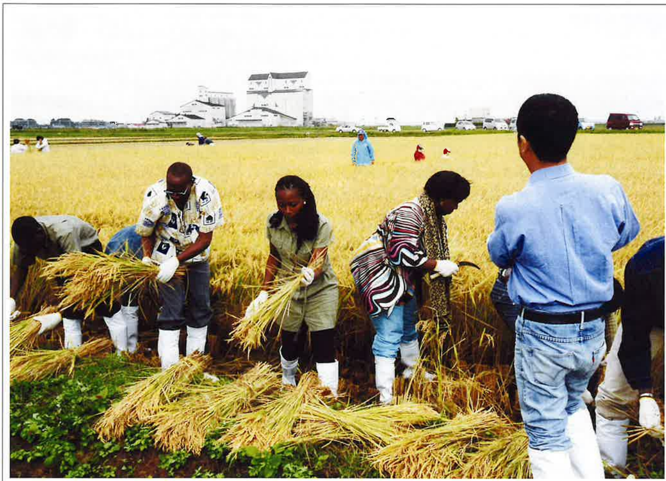
第4回水土里ネット笹川写真コンテスト最優秀作品 〔外人さんも初体験〕