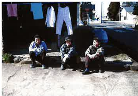
優秀賞『ようやく春がきました』