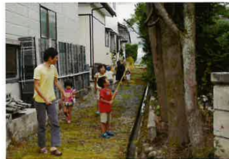
優秀賞『親子でセミ取り』