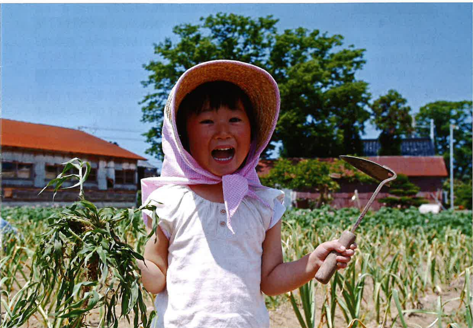
第7回水土里ネット写真コンテスト最優秀作品(草とったど〜)