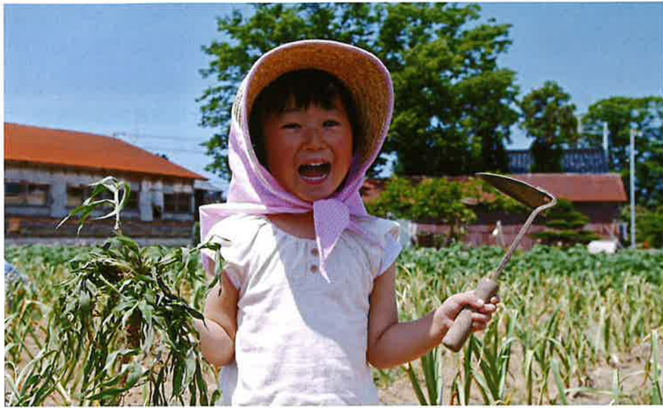
最優秀賞『草とったど〜』