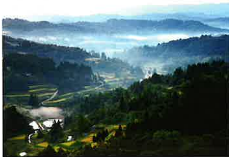
理事長賞『雲海沸き立つ』