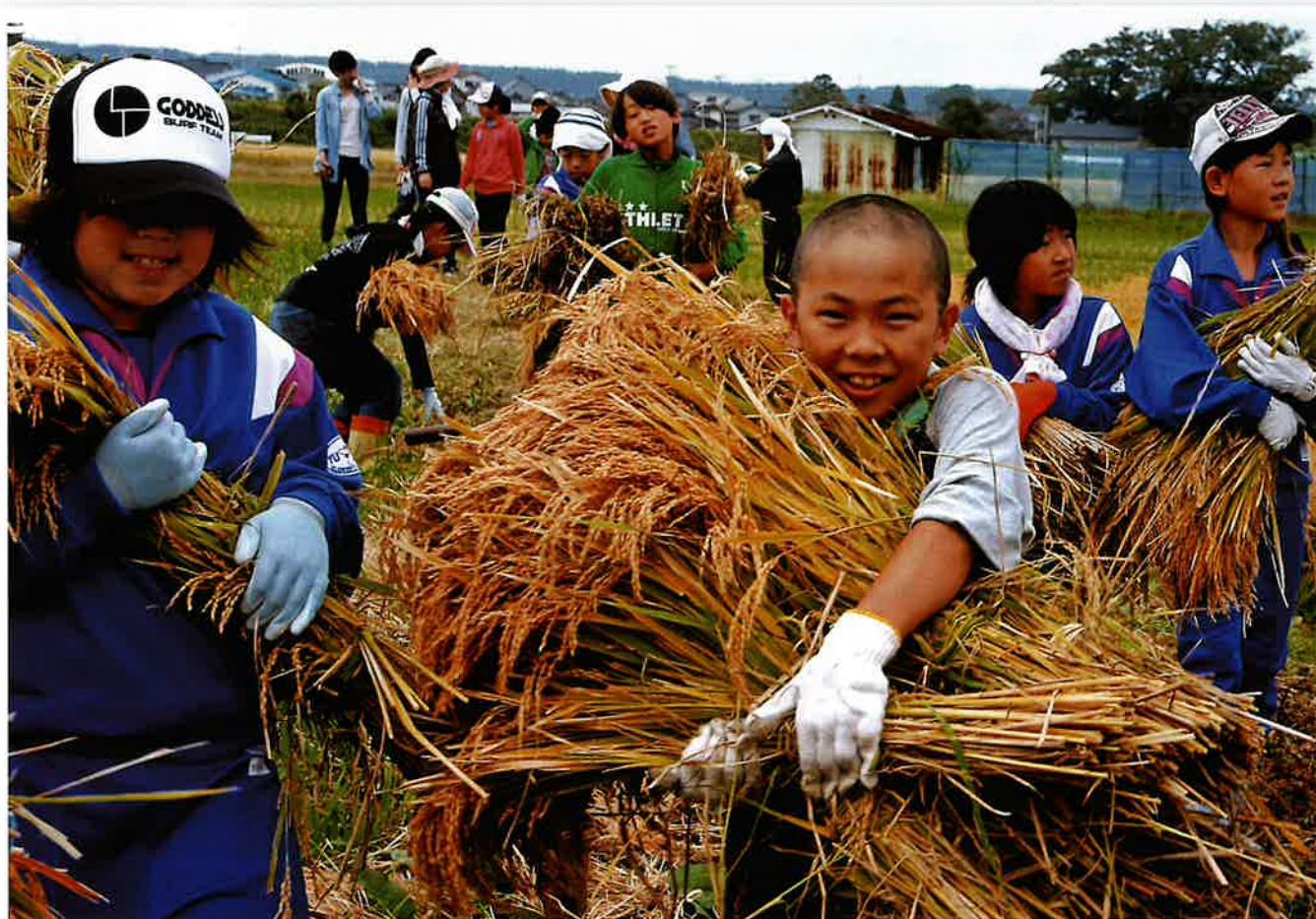
第9回写真コンテスト最優秀作品「稲刈り楽しいよー!」