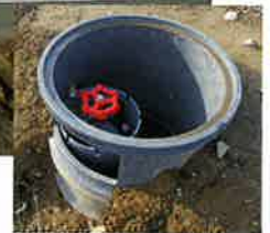
低圧パイプ給水栓