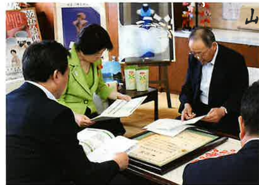
山形県知事へ表敬訪問