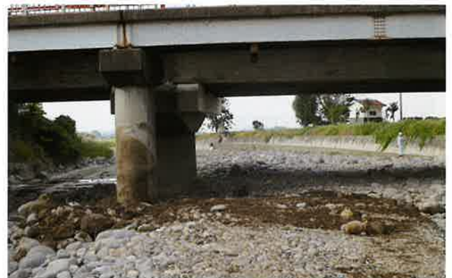
雑木撤去作業完了