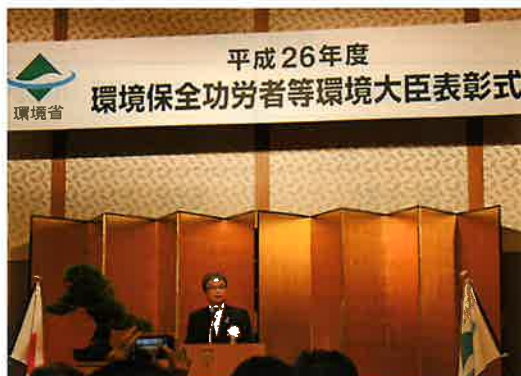
グランドアーク半蔵門にて表彰式