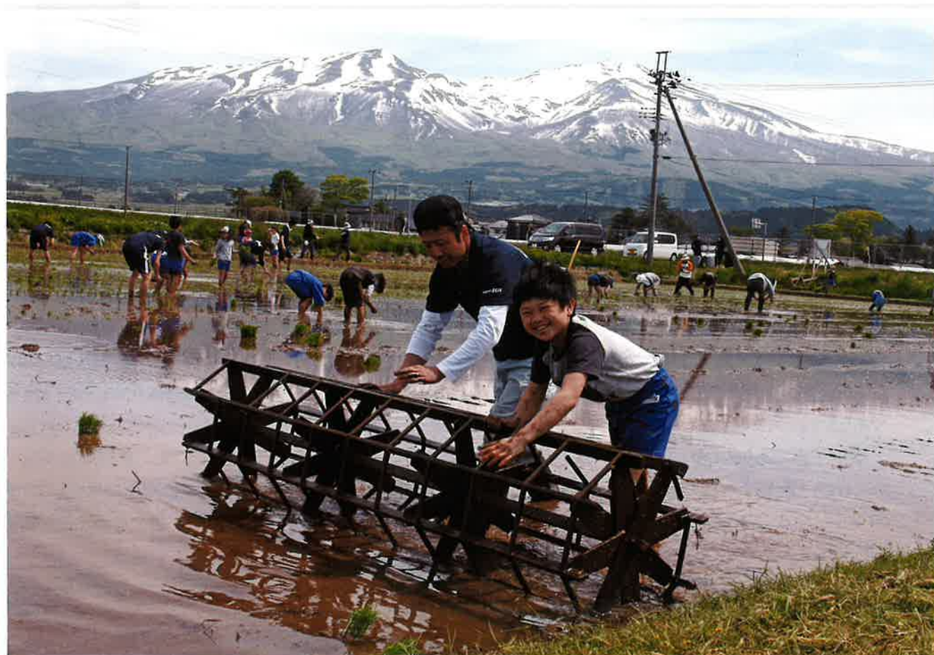
第10回写真コンテスト最優秀賞作品「田植えの日です」